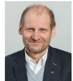
Monsignore Pirmin Spiegel, bis Juli 2024 Hauptgeschäftsführer Misereor

Selig, die Frieden stiften, ihn mit ihrer Kreativität und Beharrlichkeit bezeugen, die soziale Gerechtigkeit und die Umwelt (Mitwelt) im Blick haben, alle sie werden Töchter und Söhne Gottes genannt werden.